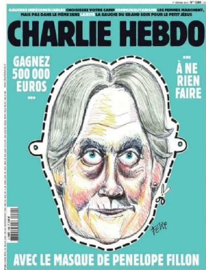
іл. 4 «Виграй 500 000 євро, не роблячи нічого, з маскою П. Фійон» (01.02.17)