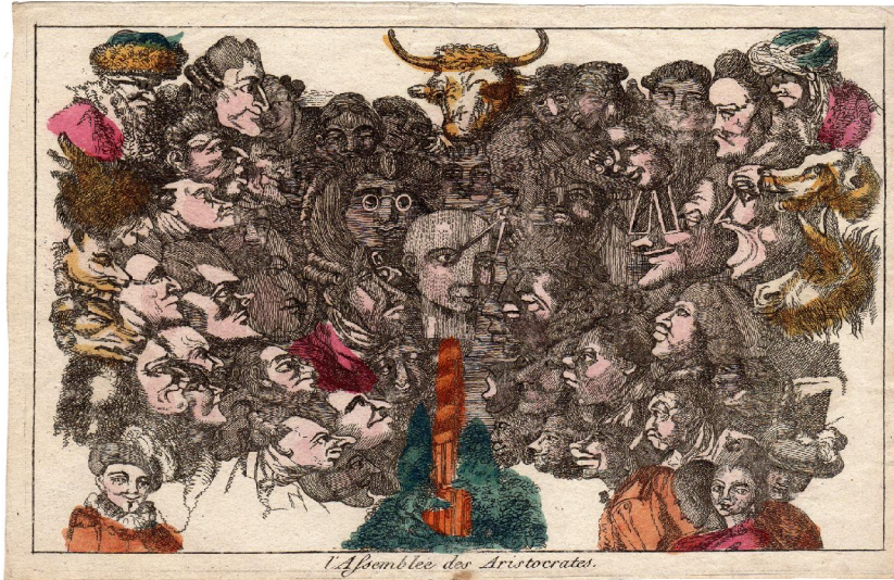
іл. 3 «Асамблея аристократів» (1790)