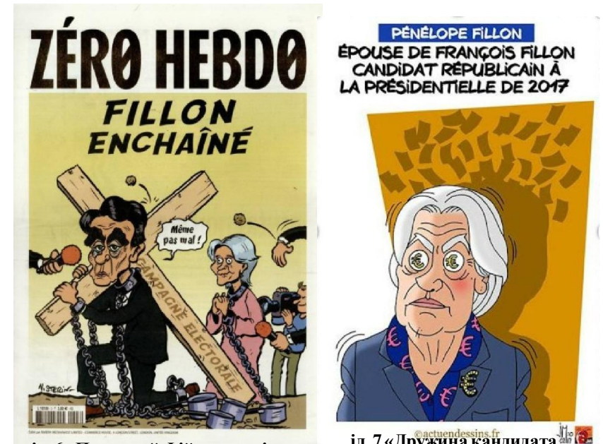
іл. 6 «Прикутий Фійон... зовсім не боляче» (23.03.17)