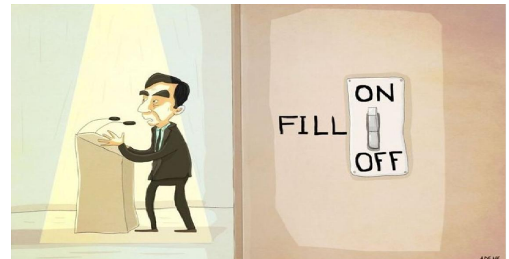
іл. 8 Робота Енн Дерен (14.02.17)

Стаття надійшла до редакції 26.05.2020 Стаття прийнята 20.06.2020