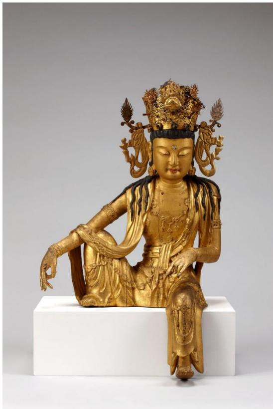
Іл. 1. Бодгісаттва Авалокітешвара (Кванім босал), створений у період Корьо, приблизно 1220-1285 років. Національний музей Кореї, Сеул, колекція Фрір | Саклер