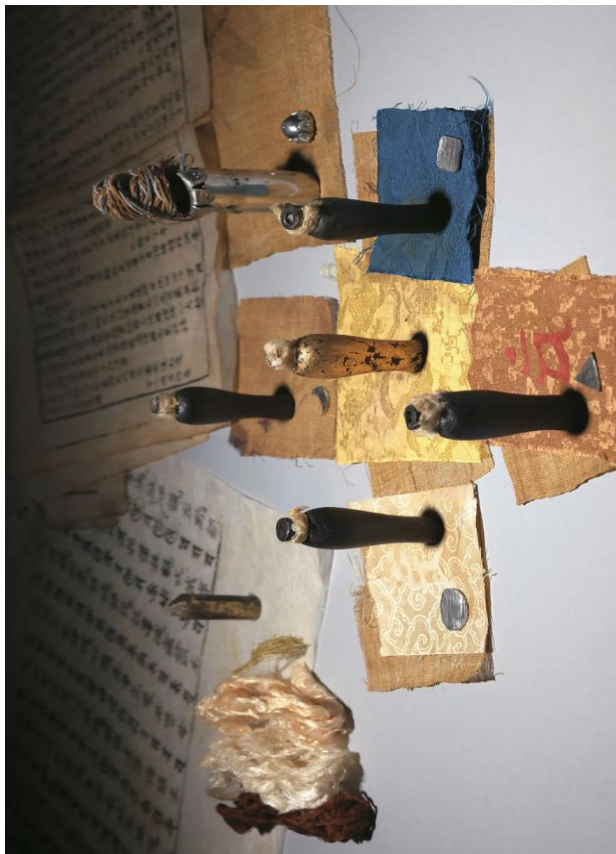
Іл. 2. Пляшки всередині скульптури бодгісаттви Кванім. (Національний музей Кореї)